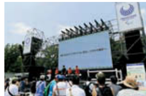
リオ2016大会時の国内ライブサイト

平昌2018冬季大会の期間中には、日本各地でライブサイトが開催されます。大画面による迫力ある競技の生中継、ステージイベント、競技体験など、みんなで楽しめる内容になっています。会場で盛り上げれば、熱戦がより一層身近に感じられるはず!