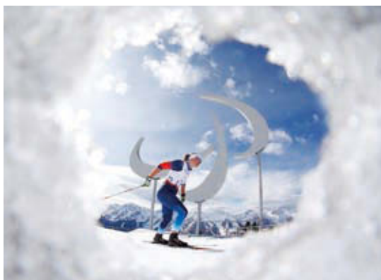
クロスカンントリー