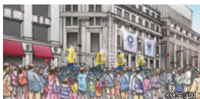
歴史・文化・商業の中心である日本橋中央通りが舞台。

オープニングでは、山車の担ぎ手だけでなく、ご観覧いただく皆さんと会場全体で盛り上がる仕掛けを用意しています。ぜひスタートからご覧ください。新グラフィックの「Go For 2020! Graphics~HANABI~」を用いた、東京2020オリンピック1000日前の特別なデーカウンターもお披露目します。こちらも注目です!