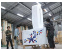
ただいま、山車を鋭意制作中。