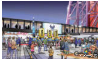
スカイツリーと連携して、ほかの建物も特別なライティングを予定しています。お楽しみに!

当日は、スカイツリーが特別なライティングになり、周辺もイルミネーションで装飾されます。オリンピック1000日前イベントから続くキャンペーン期間のフィナーレとして、各種イベントを準備。大会パートナーと連携して、パラリンピック競技や、日本のテクノロジー技術を生かしたVR体験などを予定しています。(内容は変更する場合があります。)