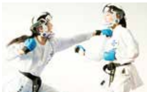
練習では安全のため、頭部防具を着用しています。