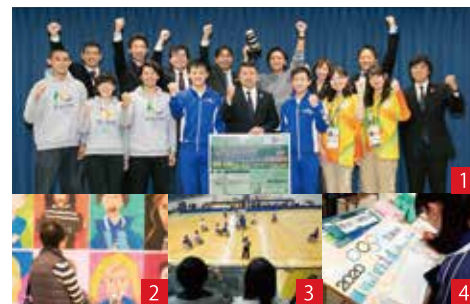
(東京2020参画プログラムより)