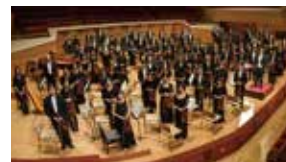
オリンピックの記念文化事業として設立された東京都交響楽団も、東京1964大会のレガシーです。

するピクトグラムの普及やホテルのユニットバスの誕生も、東京1964大会のレガシーと言われていています。このような大会後も残り続けるレガシーの創出を目指して、東京2020組織委員会一丸となって大会準備に取り組んでいきます!