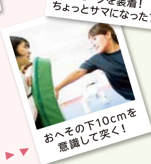
おへその下10cmを 意識して突く!