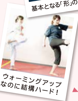
ウォーミングアップ なのに結構ハード!