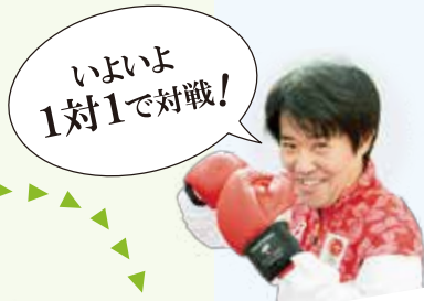
いよいよ 1対1で対戦!