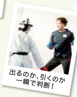
出るのか、引くのか 一瞬で判断!