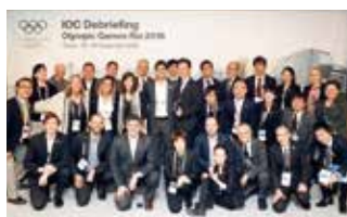
今回のデブリーフィングの運営に携わった、IOC、リオ2016関係者、東京2020組織委員会と協力会社の皆さん

デブリーフィングとは、今後行われる大会開催国の組織委員会に対して、大会運営のための知識を継承するためにIOCが主催する前大会の報告会です。