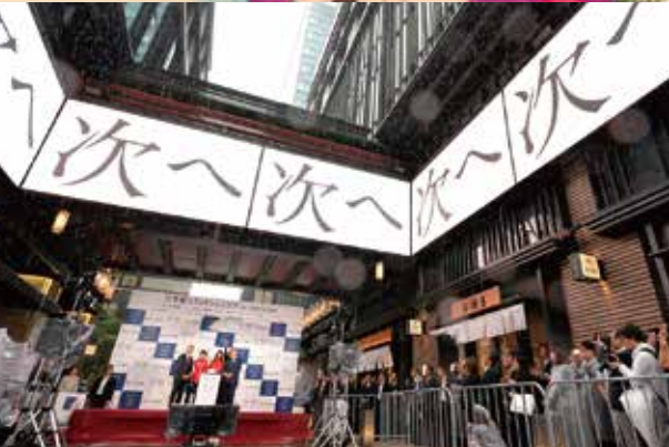
テーマ「街づくり」日本橋シティドレッシング for TOKYO 2020(三井不動産(株))