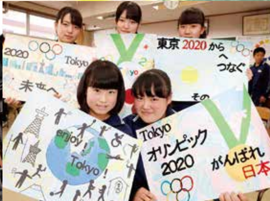
テーマ「復興」郡山市立行健中学校におけるオリンピック・パラリンピックに関するポスター制作授業公開