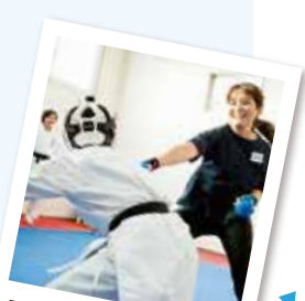
コツがつかめてきた!