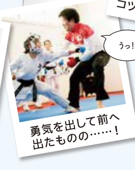
勇気を出して前へ 出たものの……!