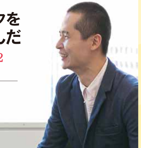
リオ2016パラリンピック ボッチャ団体銀メダリスト