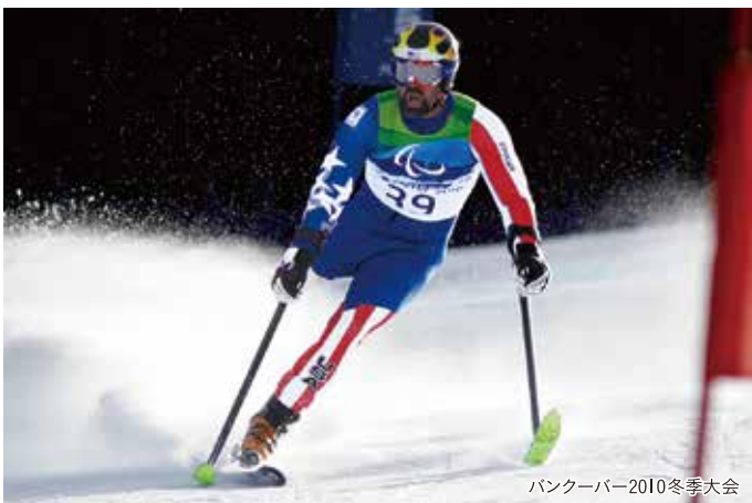
バンクーバー2010冬季大会

自信を打ち砕かれたと同時に、強い想いが込み上げた。誰よりもこのスポーツを追いかけてやろうと。