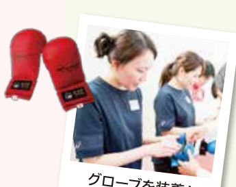
グローブを装着! ちょっとサマになった?