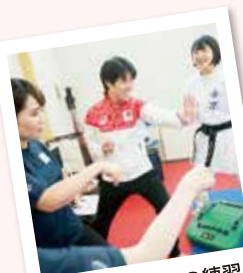
基本となる「形」の練習!