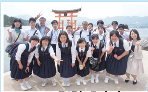
この4日間は最高の思い出です