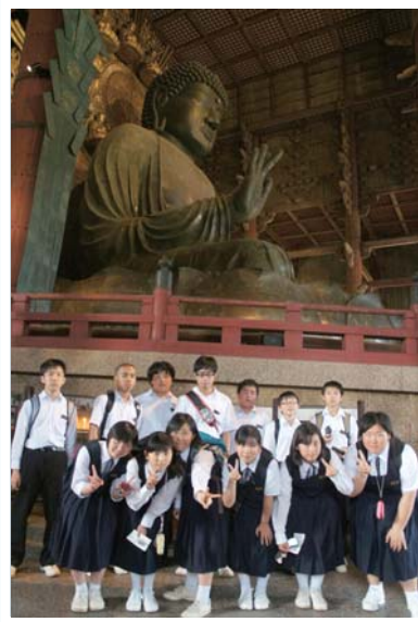
東大寺の大仏 大きくて圧倒されました