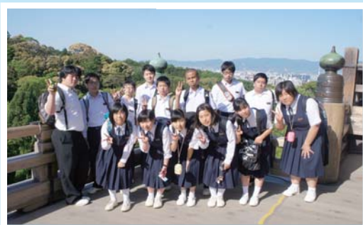
天候に恵まれ、清水寺から京都の街を見渡しました