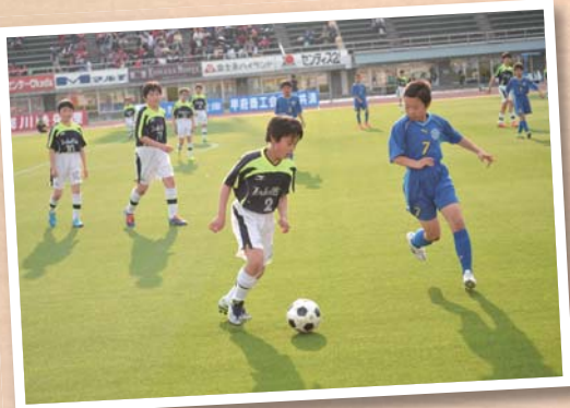
黒と黄色のユニフォームが道志トルベジーノ Jr の子供たちです

4月29日(水・祝)に山梨中銀スタジアムにおいてヴァンフォーレ甲府ホームタウンサンクスデーが開催されました。 当日は、道志村の子供たちがエスコートキッズとして選手と手を繋ぎ、元気に入場しました。また、トルベジーノ Jr の団員は選手が試合を行う前のピッチで増穂のサッカースポーツ少年団と交流試合を行いました。 結果は、浦和レッズに0対2で勝利とはなりませんでしたが、今後も道志村は変わらずヴァンフォーレ甲府のサポートを行ってまいります。