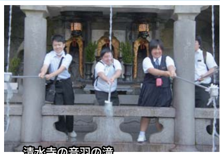
清水寺の音羽の滝 「学問上達」「延命長寿」「恋愛成就」 どの水を飲もうかな?