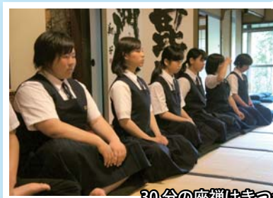
30分の座禅はきつかったな 己の弱さを痛感させられました

この修学旅行で、クラスの団結力がさらに強くなりました。一生忘れることのできない思い出がいっぱいです。