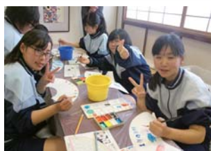
手作り京扇子 出来上がりが楽しみです

5月9日から12日に3泊4日で、道志中学校3年生14名は、奈良・京都・広島へ修学旅行へ行ってきました。