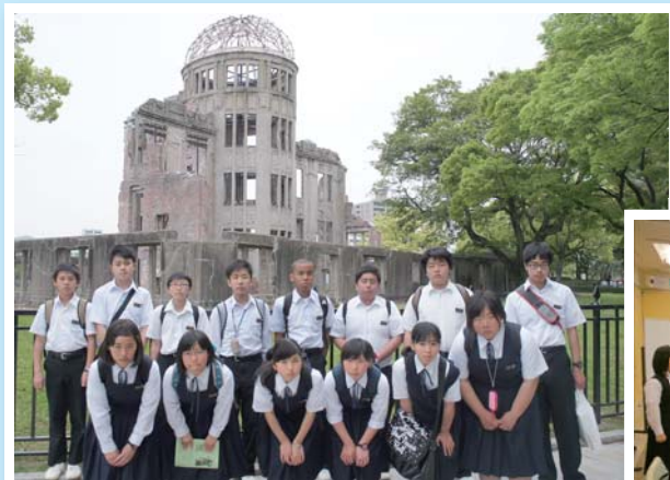
原爆の悲惨さを聞き、身近な平和に改めて感謝しました