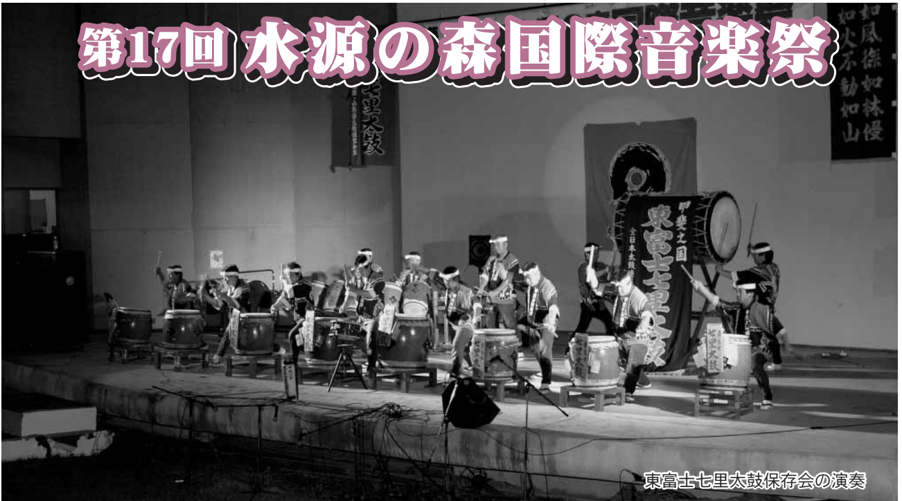
東富士七里太鼓保存会の演奏