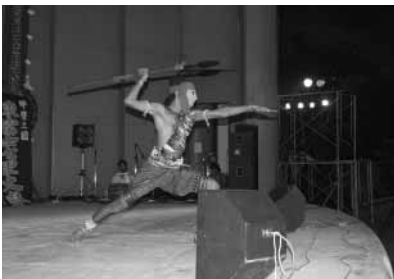
インド仮面舞踊 セライケラ・チョウ