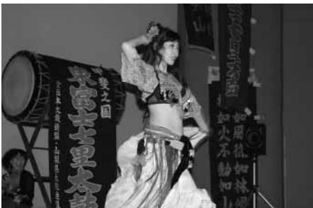
古代オリエントより伝わる踊り、ベリーダンス（アルカマラーニの皆さん）

す、うなぎのつかみ取りを子どもたちが行い好評でした。夕方からは野外ステージにおいて、ジャズ、勇壮な太鼓集団の碑、弥鼓、サンバの踊り、インド仮面舞踏会が開催されました。インド仮面舞踏会は、