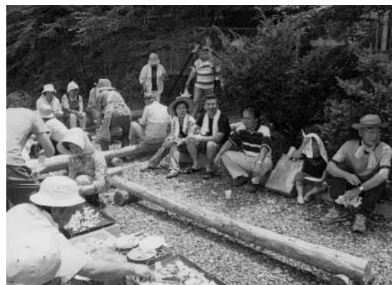
体験農園での交流会