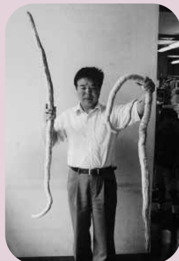
役場庁舎内で撮影 （産業観光課長）

体験農園管理棟 ☎ 0554-20-4581 産業観光課 ☎ 0554-52-2115