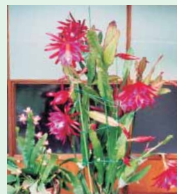
クジャクサボテン