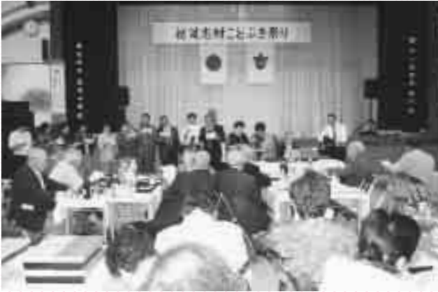
参加者全員で合唱を行う