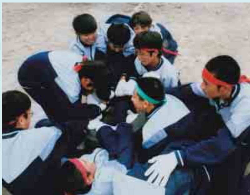
道志中学校若鮎祭（体育部門）