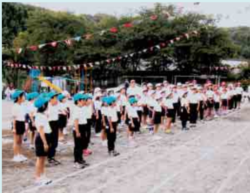
道志小学校運動会