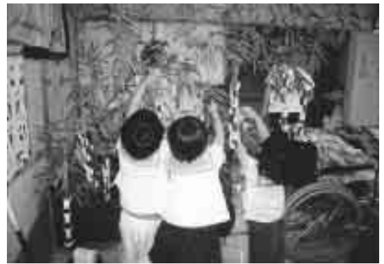
願いごとが叶いますように

るの願い事を書いて、その願いが達成できますようにお祈りしたそうです。 福祉センターにおいて恒例の七夕飾りを、七月十日保育園児とデイサービス利用者の方々により盛大に行いました。 デイサービスの方も童心に戻り、園児たちと和やかな会話をしながら葉竹に短冊など飾り付けをする姿は、ほんとに幸せいっぱいの様でした。 また、飾り付け後には、みんなで歌や、遊技を行なう。 最後は参加者全員で記念撮影を行うなど、楽しい一日であったと同時に明日への活力になった事でしょう。