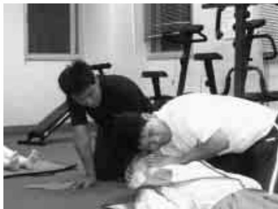
講習を受ける体育指導員

七月十七日、スポーツプラザ屋内プールにおいて、心肺蘇生法等の練習を実施し、体育指導員が参加しました。私達はいつ、どこで、突然のけがや病気におそわれるか予測できません。病院に行くまでに家庭や職場でできる手当てやプールで溺れたり、喉にお餅を詰まらせたときのように呼吸ができなくなったり心臓が止まってしまうものなどいろいろとありますが、このようなときに、救急車がくる