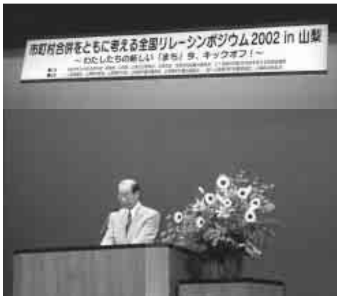
挨拶をする天野知事

七月十三日都留市文化ホールにおいて市町村合併をともに考える全国リレーシンポジウム2002年 in 山梨が開催され道志村からも村議会議員や、職員も出席しました。支援本部員も務める横内正明衆議院議員や、天野建知事らがあいさつ、横内衆議院議員は「合併手続きに二十二月はかかるため、合併特例法の期限法の期限を考えるとこの一年が正念場となる」と論議の活発化を呼び掛けた。パネルディスカッションには、高部正男総務省大臣官房審議官や開催地の小林義光都留市長、富沢町と合併を推進する小沢介三南