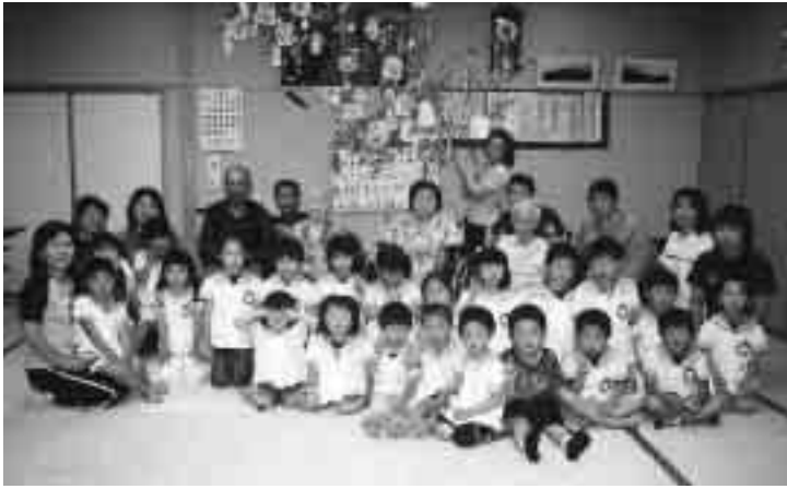
全員でハイポーズ