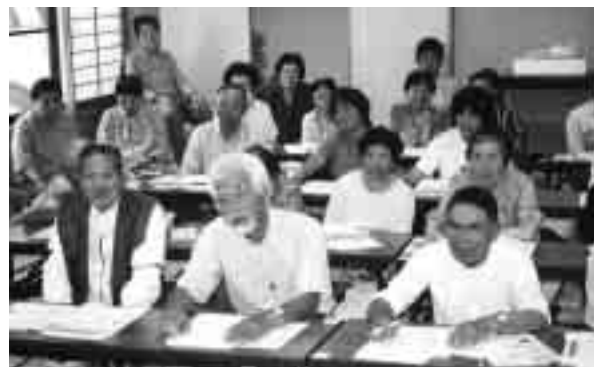
講座を受ける参加者