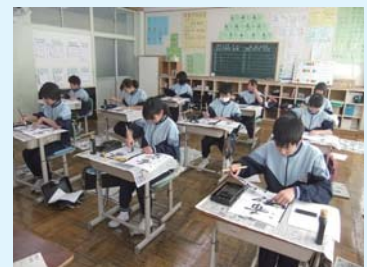
集中して、心を込めて。今年の書き初めです。

始業式に続いて、最初の行事である書き初め大会を教室で行いました。どの生徒も冬休み中に練習した課題の字を心を込めて書いていました。