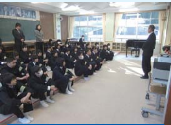
始業式 校長先生からのことば

1月13日に3学期が始まり、音楽室で始業式を行いました。式の中では、各学年の代表が3学期の決意を發表しました。それぞれ、短い学期を有意義に過ごしていくという意欲が語られました。みじかい3学期ですが、有終の美が飾れるよう意義ある学期にしてほしいです。