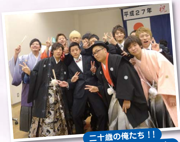
二十歳の俺たち!! 決まってるら!!