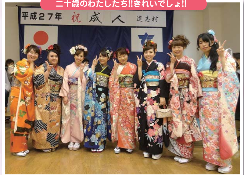
二十歳のわたしたち!!きれいでしょ!!