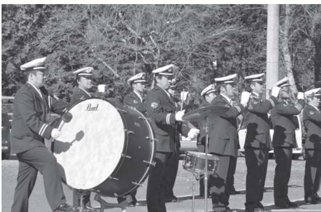
音楽隊によるラッパ吹奏