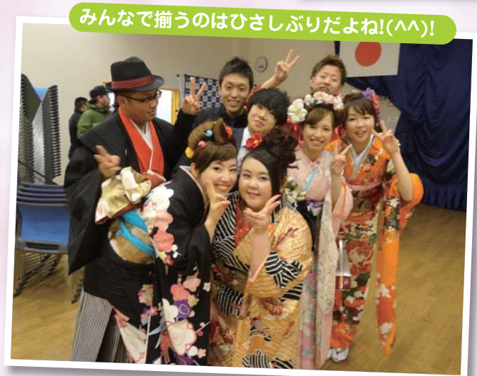
みんなで揃うのはひさしぶりだよね!(^^)!

広報1月号の『成人者名簿』において、掲載内容に誤りがございました。関係各位にはご迷惑をお掛けしましたこととお詫びするとともに、次のとおり訂正させていただきます。