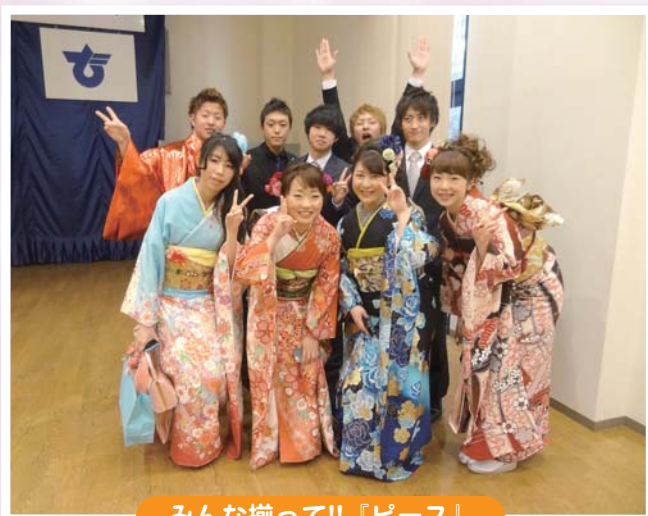
みんな揃って!!『ピース』