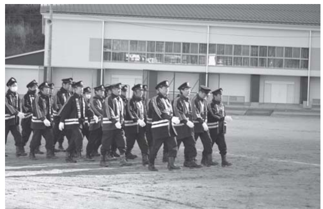
消防団員による分列行進