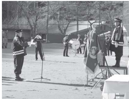
代表者による新入団員宣誓

や夜間の警戒活動など尽力を頂いております。そのような功績が認められ当日、栄えある表彰をお受けになられた皆様誠にありがとうございます。心からお祝い申し上げます。