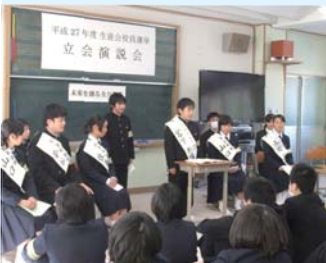
道志中をさらに良くするためにがんばります

12月8日に生徒会役員選挙が行われました。立会演説会では各候補者と責任者が限られた時間の中で自分たちの具体的な考えを述べました。その後の投票で新生徒会の役員が決められました。執行部となる役員が中心となり、生徒会をさらに発展させるよう、これからの活躍を期待します。